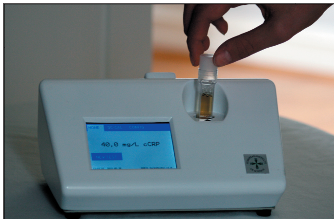
EURIS TurboReader™ veterinärt instrument för patientnära (POC) blodmätning av hund-CRP. Instrumentet erhölet EMC CE-godkännande enligt EN61326-1:2013 och EN61326-2-3:2013 vilket innebär att det uppfyller kraven på elektromagnetisk kompatibilitet (d v s att det inte kan störas av och inte blir störd av annan elektrisk utrustning) och att denna delkomponent i bolagets blodanalyssystem får säljas till kunder inom EU. Med instrumentet kan 15 stycken blodanalyser av bl a hund-CRP (inflammationsmarkör) göras per timme. Vid batteridrift kan instrumentet användas under en hel arbetsdag utan tillgång till nätspänning.

Instrumentet är kompakt för att inte ta upp onödig arbetsyta hos kunderna samt väger ca 1 kg. Det kräver inga extra kalibrerings- eller skötselprocedurer och är redan anpassat för internationellt bruk med en bred spänningsmatning (100-230 V och 50-60 Hz). Instrumentet är CE-märkt och uppfyller således EUs EMC normer. Instrumentet har en datorkommunikationsport (RS232) för utskrift av data (skrivare finns som tillval) samt för tvåvägs dataöverföring (LIS). Vidare är instrumentet anpassat för fältbruk eftersom det även är batteridrivet (5 V).