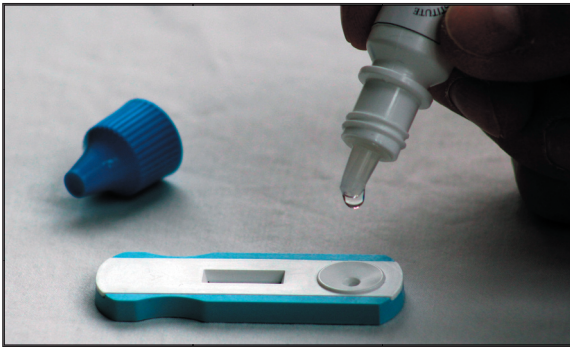
European Institute of Science AB har tillsammans med vår amerikanska joint venture partner utvecklat ett snabbtest för veterinärmarknaden. På bilden syns lateral flow snabbtestet för inflammationsmarkören CRP i hund.

European Institute of Science AB (EURIS) har slutit ett joint venture avtal med ett bolag i USA som är verksamt inom produktion och försäljning av antikroppar och proteinreferenser. Joint venture avtalet omfattar en gemensam utveckling av teknologi samt kommersialisering av lateral flow baserade snabbtest för veterinära marknaden. Avtalet omfattar en global försäljning av snabbtest under EURIS varumärke. Ett snabbtest för hund-CRP planeras bli den första produkten som kommer att kliniskt evalueras samt att lanseras under år 2016 på veterinärmarknaden.