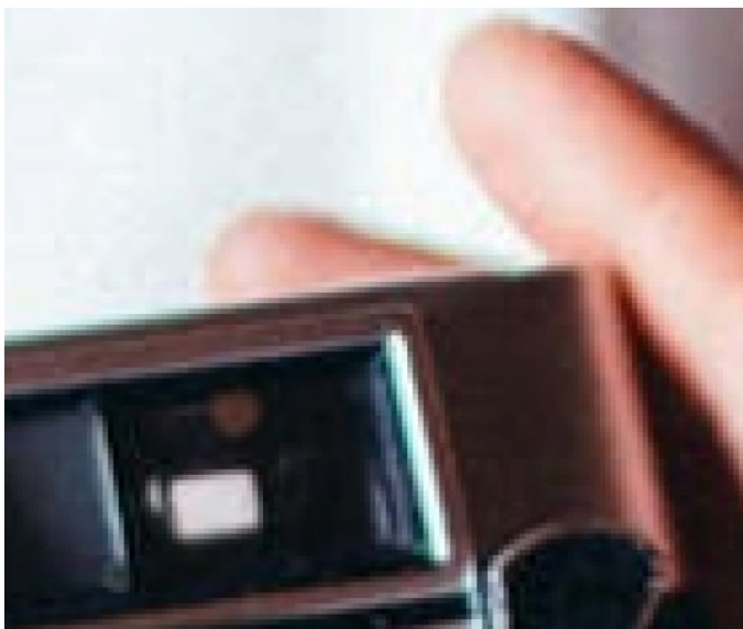
FIG. 1 Förstorad bild av figuren nedan, varav små pixlar kan urskiljas

Tekniken bakom Bolagets tjänst kan i grunden förklaras enkelt med hjälp av en sedvanlig "bildanalys". En digital bild är uppbyggd av ett stort antal pixlar, en s.k. "kvaradratisk ruta", som var och en är enfärgad. Tillsammans bildar samtliga pixlar ett stort rutnät där det mänskliga ögat uppfattar rutnätet till en sammanhängande bild, se Fig. 1.